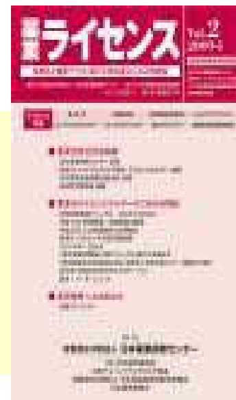
最新情報と問題・レポート掲載の 情報季刊誌