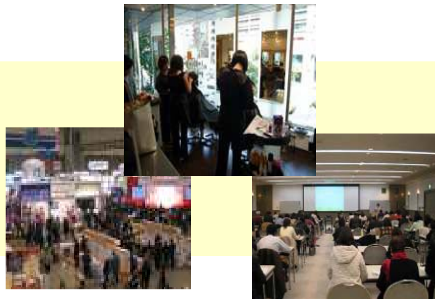
JACDS主催・認定研修会