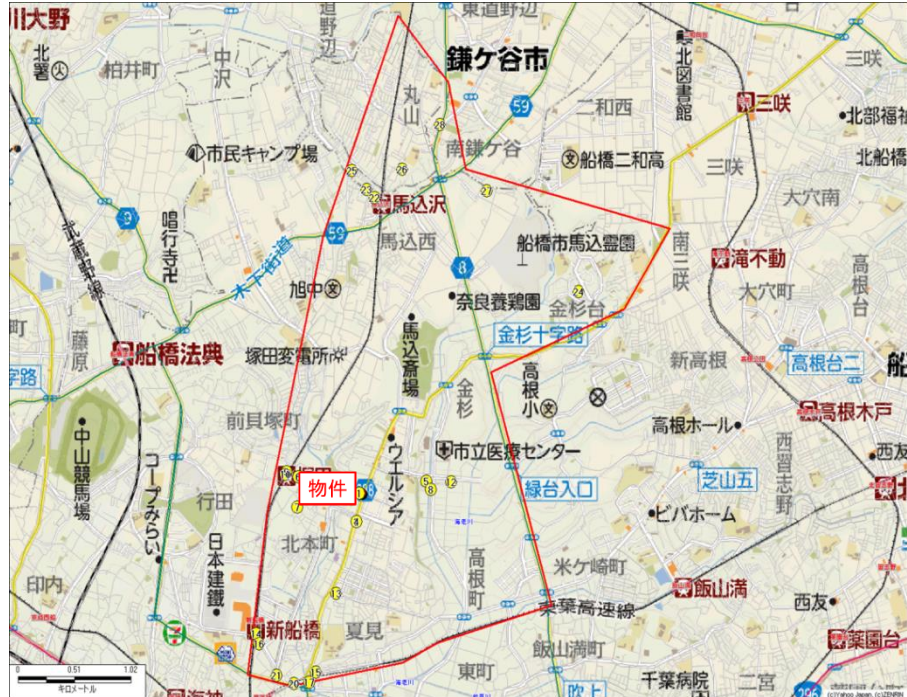
※診療圏エリアは、分断要因と生活導線およびドラッグストアの商圈を考慮して設定。