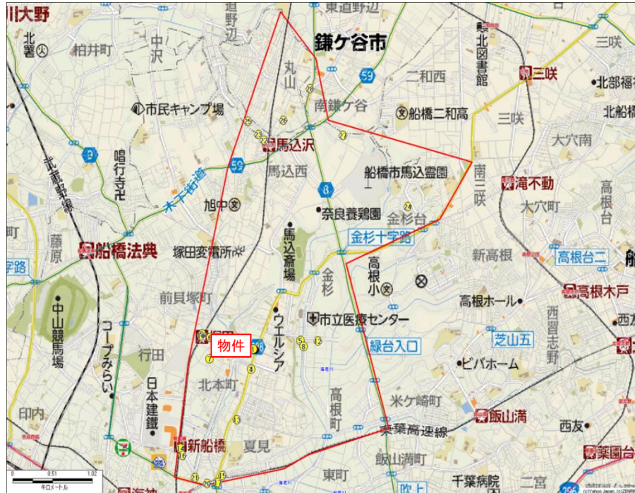
※診療圏エリアは、分断要因と生活導線およびドラッグストアの商圈を考慮して設定。